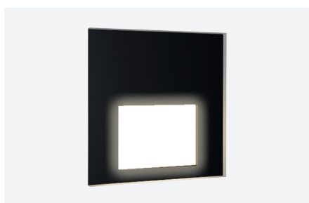
ID498194NZZ (vierkante afdekplaatje - zwart glas)