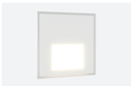
ID498193BZZ (vierkante afdekplaatje - wit glas)