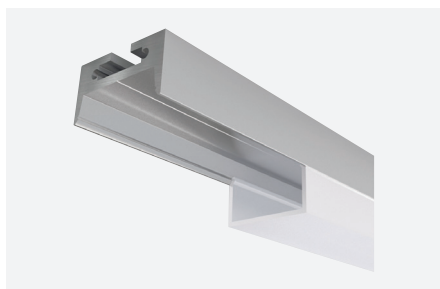
ID638002AAZ (2 m - aluminium anodisé)