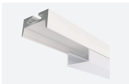
ID638312BSZ (2 m - blanc structuré)