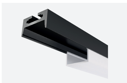
ID638412NSZ (2 m - noir structuré)