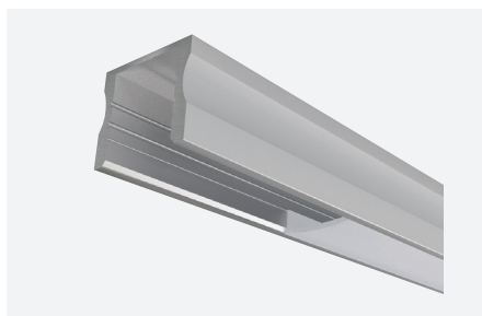
ID588002AAZ (2 m - aluminium anodisé)