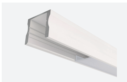
ID588302BSZ (2 m - blanc structuré)