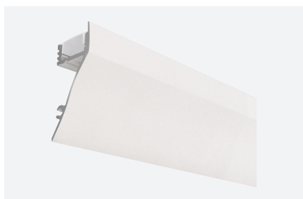
ID588063BEZ (2 m - blanc satiné)