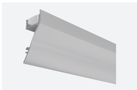
ID588061AAZ (2 m - aluminium anodisé)