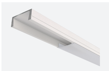
ID588311BSZ (2 m - blanc structuré)