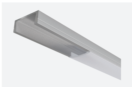
ID588011AAZ (2 m - aluminium anodisé)