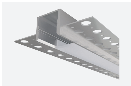
ID588019BEZ (2 m - aluminium anodisé)