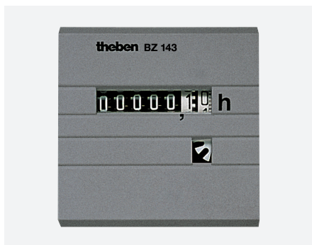
BZ143-1 230V 50HZ