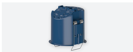
907.0.992, plafondinbouwdoos 68A