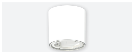
FRAME thePixa WH 9070816, behuizing voor opbouwmontage