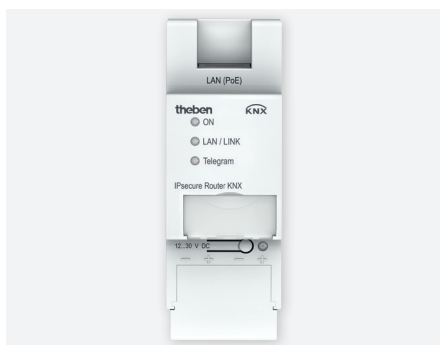
IP secure-Router KNX