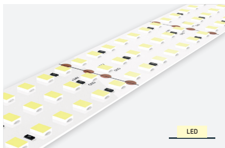
ID551705BZE (3.000 K - IP20 - 2 m) ID551702BZD (4.000 K - IP20 - 2 m)