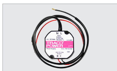
907.0.494, netadapter voor inbouwmontage