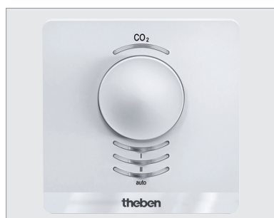
AMUN 716 SR