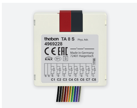
TA8 S KNX