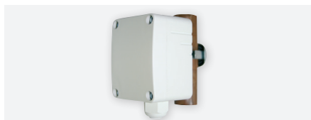
907.0.489, temperatuursensor in behuizing met scharnierend deksel voor het meten van de temperatuur op pijpen en gebogen oppervlakken