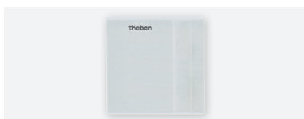
907.0.459, temperatuurvoeler IP65