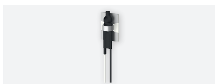
907.0.496, temperatuurvoeler voor inbouw