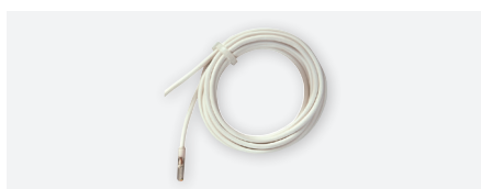
907.0.321, sensor voor vloertemperatuur