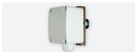
907.0.489, temperatuursensor in behuizing met scharnierend deksel voor het meten van de temperatuur op pijpen en gebogen oppervlakken