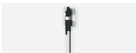
907.0.496, temperatuurvoeler voor inbouw