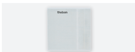
907.0.459, temperatuurvoeler IP65