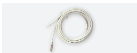
907.0.321, sensor voor vloertemperatuur