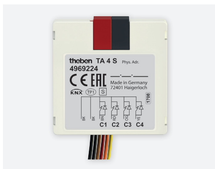
TA4 S KNX