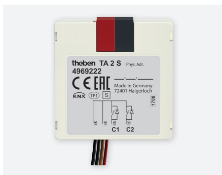
TA2 S KNX