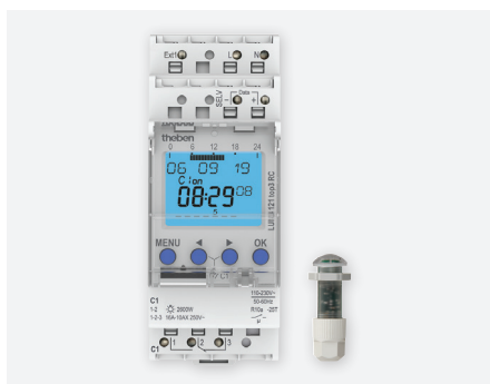
LUNA 121 TOP3 RC EL