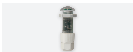
907.0.456, capteur de luminosité (montage encastré)