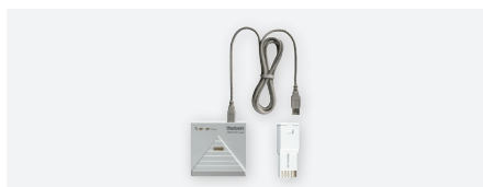
907.0.409, kit de programmation Obelisk