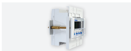
907.0.001, kit pour montage encastré