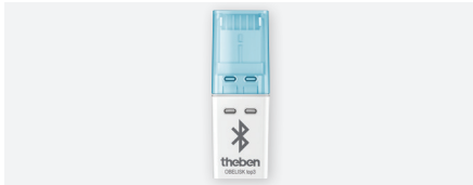
OBELISK top3 , carte mémoire amovible Obelisk top3