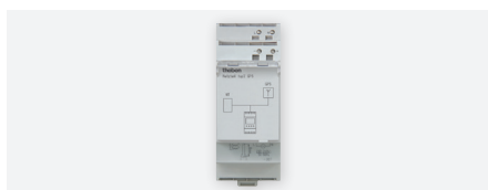
907.0.892, alimentation pour antenne GPS