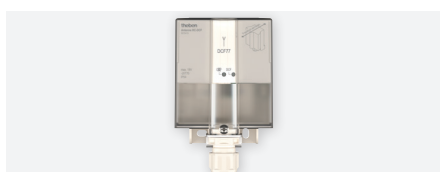
ANTENNE DCF77, antenne DCF 77