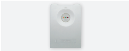
ANTENNE GPS , antenne GPS