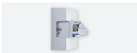
907.0.064 (CB-TR2), cache-bornes