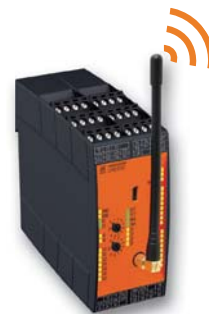
Module de sécurité radio UH 6900