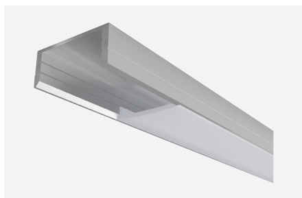
ID588014AAZ (2 m - aluminium anodisé)