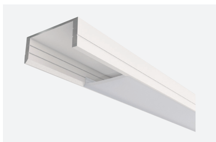
ID588314BSZ (2 m - blanc structuré)