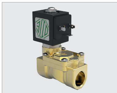
21WA4KOV130-BDA230AC-305 , 2-weg magneetventiel 1/2", NG, 230 V AC, 8 W, FKM