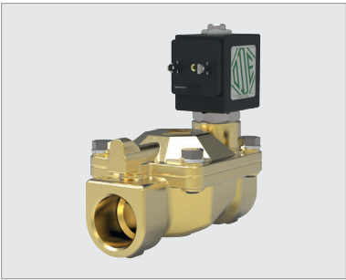
21W4ZB250-BDA230AC-305, électrovanne 2 voies 1", NO, 230 V AC, 8 W, NBR