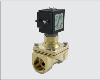
21HT5ZOY160-BDA230AC-305, électrovanne 2 voies ¾", NO, 230 V AC, 8 W, NBR