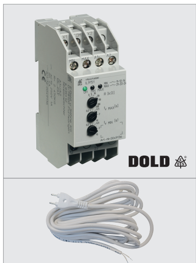
KIT IL AQUA