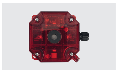
ACC SRL 230 , signal lumineux 6 W + sirène 100 dB, 230 V AC