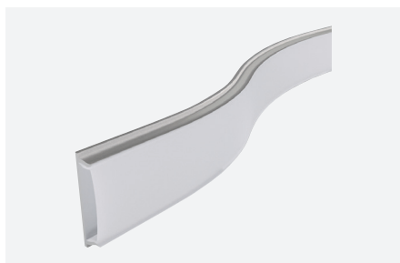
ID588013AAZ (2 m - aluminium anodisé)