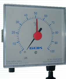
EXAKT 2 SUPER-G