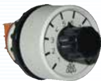
Potentiometer AD3 10kOHM