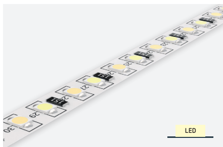
ID651072BZG (2.700 K + 6.500 K - IP20 - 5 m)