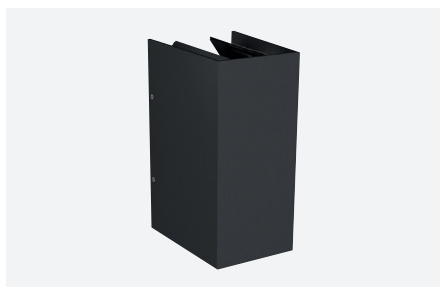
ID571206FSC (gestructureerd antraciet grijs)