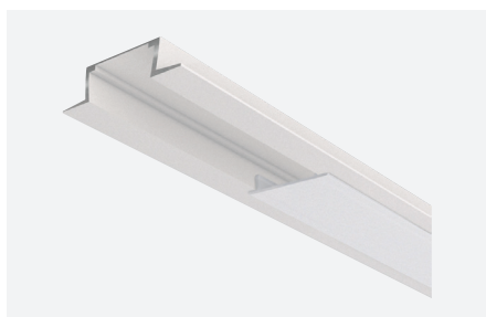
ID588316BSZ (2 m - blanc structuré)