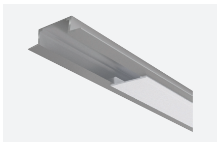
ID588016AAZ (2 m - aluminium anodisé)