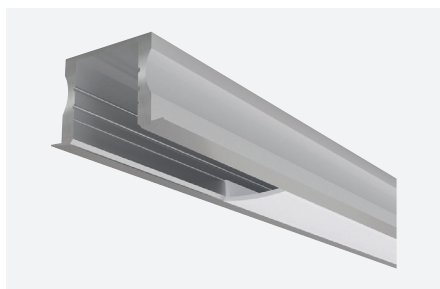
ID588006AAZ (2 m - aluminium anodisé)