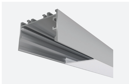
ID638022AAZ (2 m - aluminium anodisé)