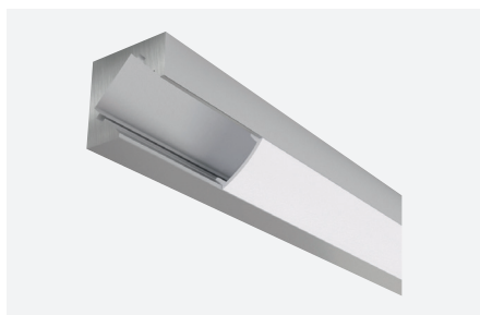
ID588021AAZ (2 m - aluminium anodisé)