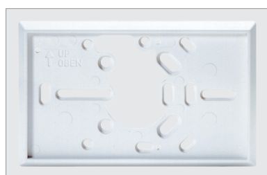
007.63.2488.001 (ARA 1.7 E), plaque de montage sur boîte d'encastrement