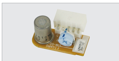
ACM G01 , capteur LPG de remplacement précalibré