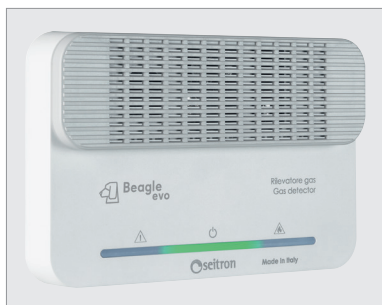
Détecteur de gaz BEAGLE EVO LPG