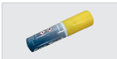
CHM1580001 , cartouche de test permettant de vérifier le bon fonctionnement des détecteurs de méthane et de LPG, contenant du gaz non titré. Quantité de gaz suffisante pour environ 70 tests.

Le BEAGLE EVO LPG est un détecteur de fuites de LPG destiné à des applications domestiques, équipé d'un relais de sortie permettant de commander une électrovanne 230 V AC ou basse tension.