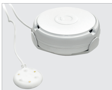
Avec câble de détection de fuites