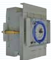
Set voor inbouwmontage, ref. 907 0 001