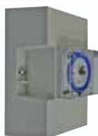
Klemmendeksel voor wandmontage, ref. 907 0 050