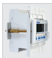
907.0.001, kit pour montage encastré