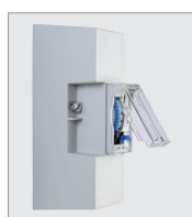
907.0.065 (CB-E8), kit cache-bornes pour montage mural