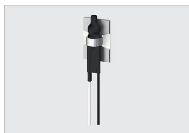
907.0.496, ingebouwde temperatuursensor