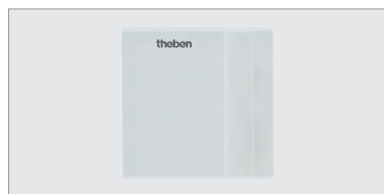
907.0.459, ruimtevoeler IP65