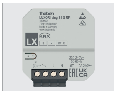
LUXORliving S1 S RF