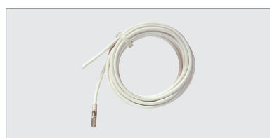
907.0.321, sonde sol