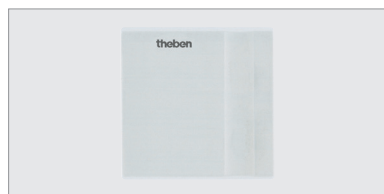
907.0.459, sonde d'ambiance IP65