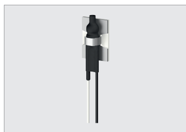
907.0.496, capteur de température encastré