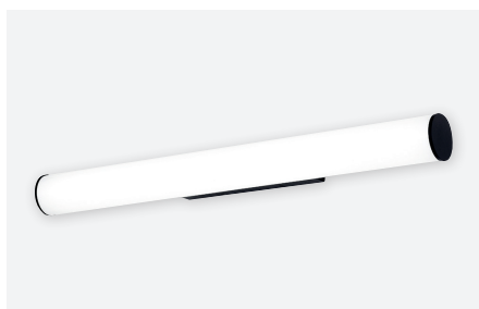
IDTL851431NSC (24 W - gestructureerd zwart)