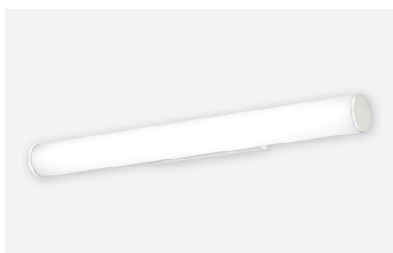
IDTL851430BSC (24 W - gestructureerd wit)