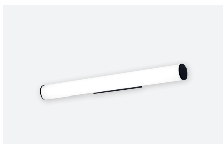
IDTL851411NSC (12 W - gestructureerd zwart)