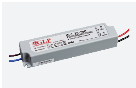
MPL-GPC-20-700 (19,6 W - 700 mA)