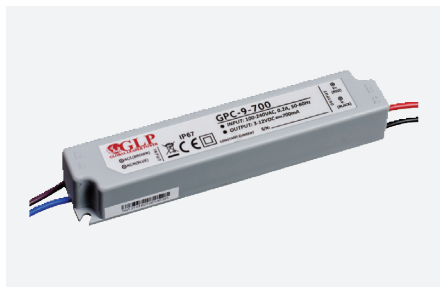
MPL-GPC-9-700 (8,4 W - 700 mA)