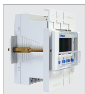
907.0.001, kit pour montage encastré