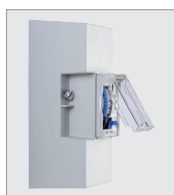
907.0.065 (CB-E8), kit cache-bornes pour montage mural