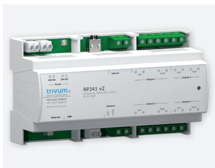
RP341 - V2