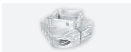
907.0.928, mastbevestiging weerstation