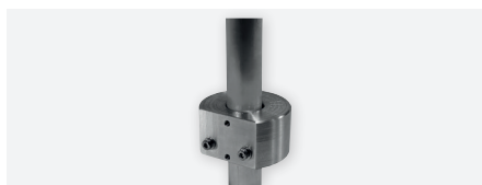
907.0.925, mastbevestiging WML1