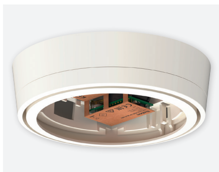
Set basic KNX AP Multi WH