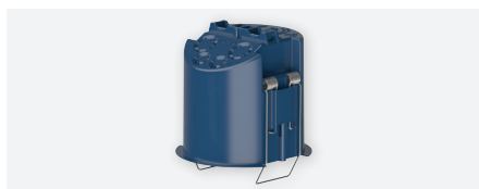
907.0.992, plafondinbouwdoos 68A