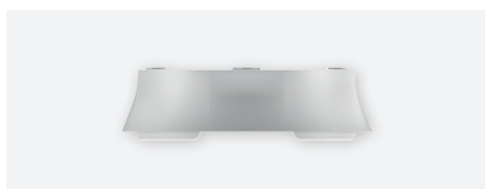
FRAME 110B WH 9070918, behuizing voor opbouwmontage