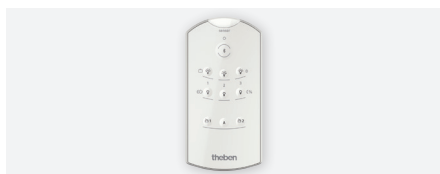
theSenda B, afstandsbediening met App theSenda Plug