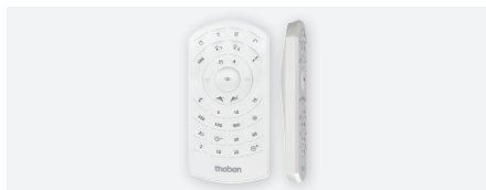
theSenda P, serviceafstandsbediening