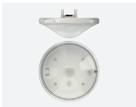
thePrema S360 KNX UP WH