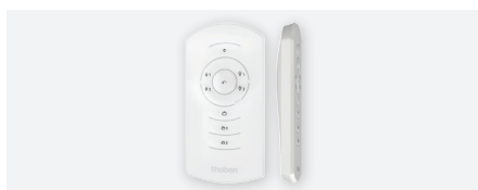
theSenda S, gebruikersafstandsbediening