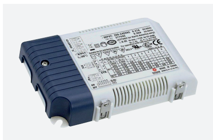
ID229215ZZZ (45 W)