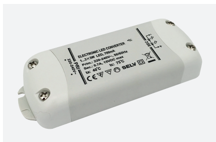
ID409063ZZZ (10 W)