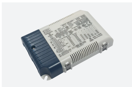
ID229214ZZZ (45 ou 60 W - DALI)