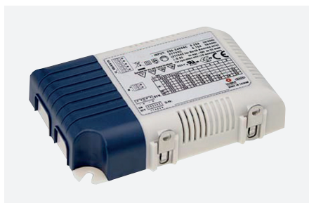
ID229208ZZZ (18 of 25 W - DALI)