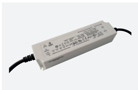
ID229101ZZZ (60 W - PFC)