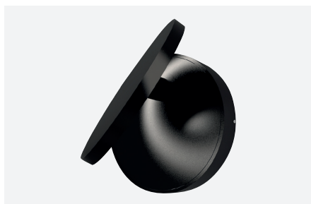
ID494043NSC (noir structuré)