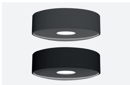
ID571401FSC (gris anthracite structuré) ID571402NSC (noir structuré)